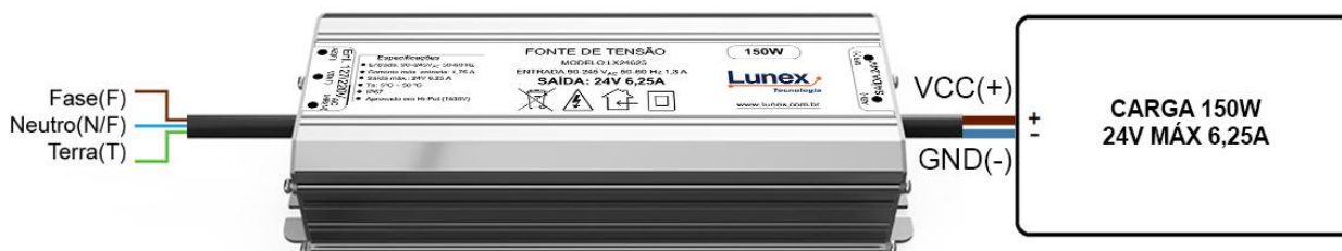
Diagrama de ligação da Fonte de Tensão LX24065, proporcionando uma referência visual clara para instalação e conexão do dispositivo. Facilite o processo de montagem e garanta a utilização segura e eficiente da fonte, simplificando suas instalações e obtendo máximo desempenho com nosso diagrama.